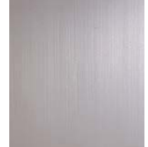
アルミ電解着色 シャインブルー