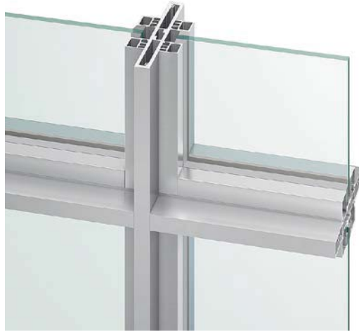
100方立12(角パイプ風押縁タイプ)

極限まで細さを追及した12mm見付の方立と無目は、従来のパーティションのイメージを覆すシャープな印象をもたらします。