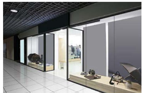
FIX窓(ガラスつき合わせ)