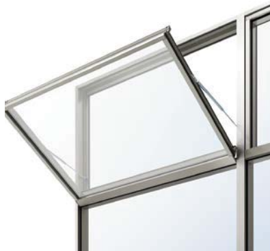
スリム外倒し窓(排煙オペレーター)

ステンレスの板曲げでは難しい細見付のフレームにも対応。また、方立・無目の嵌合ラインを隠し、ノイズレスでスリムな意匠を実現します。