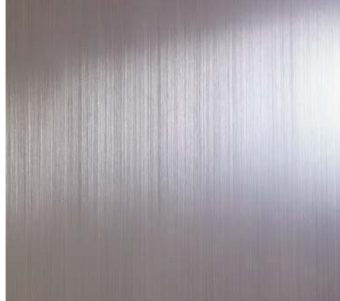
ナチュラルステンH

建物のエントランスまわりに多く使われるステンレスヘアラインに代わって、アルミ素材にヘアライン処理と電解着色を施した「テクスライト」を完成。まるでステンレスのような輝きと低コストを両立した、新しいフロント素材です。