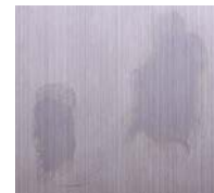
ステンレスヘアラインに 付着しやすい手あか等