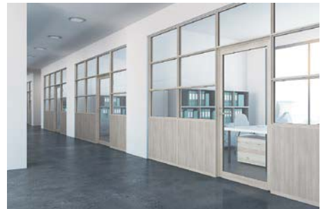
丁番ドア+木製パネル+FIX窓