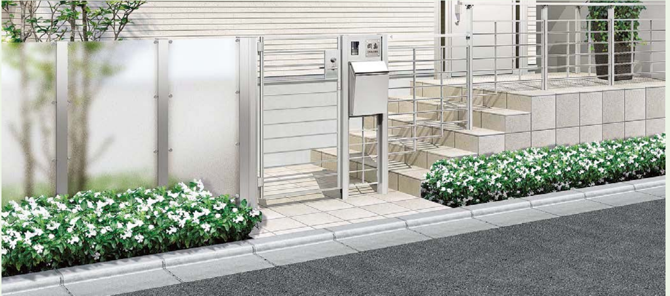
アーキキャストフェンスFS型