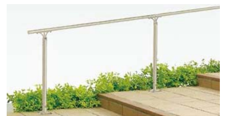
A型(アルミ笠木) 上部笠木用アルミ柱 ベースプレート式 階段納まり [シャイングレー]