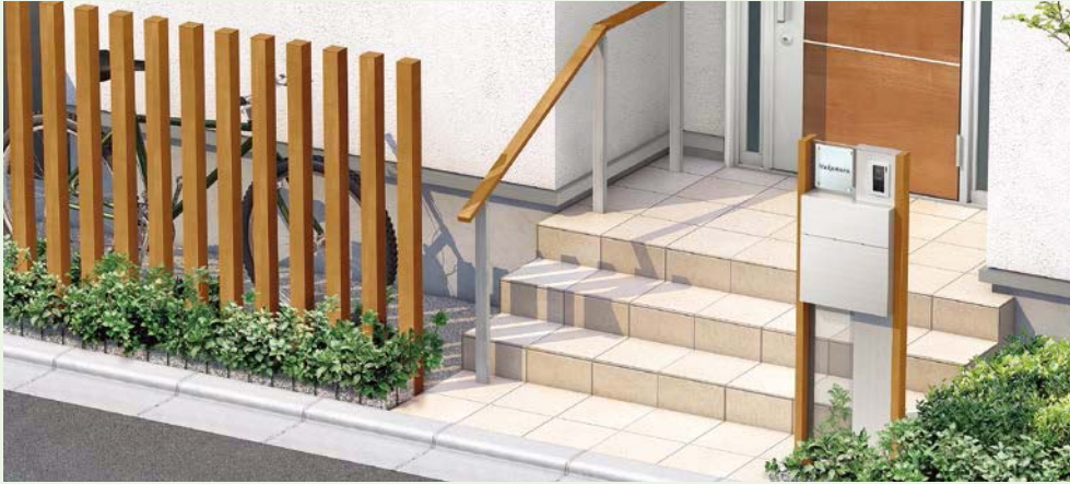
埋込用角柱使用 笠木:クリエラスク 柱:シャイングレー