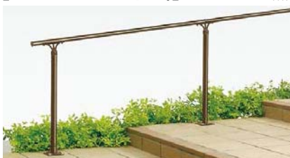
A型(アルミ笠木) 上部笠木用アルミ柱 ベースプレート式 階段納まり [オータムブラウン]