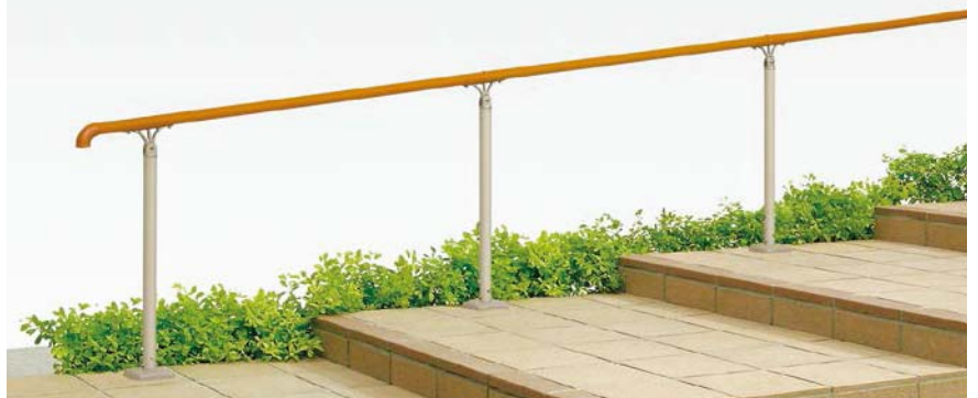
B型(樹脂笠木) 上部笠木用アルミ柱 埋込み式(足元カバーつき) 階段納まり [オレンジ+シャイングレー]