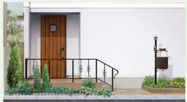
埋込用丸柱使用+横棧+縦棧 欧風E付き 笠木:ブラック 柱:ブラック