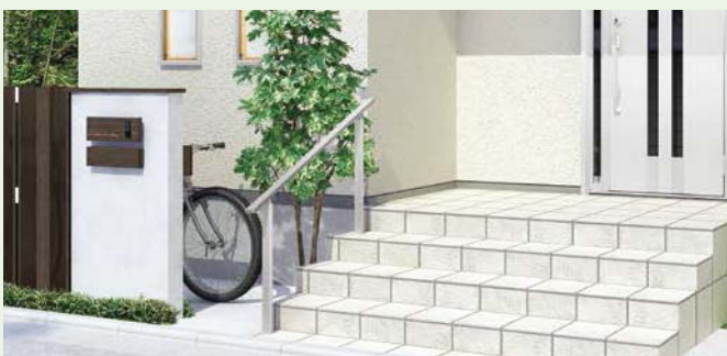
埋込用角柱使用 笠木:ステンスラッピング 柱:ナチュラルシルバーF