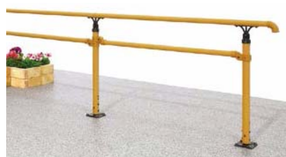
B型(樹脂笠木) 上部笠木用樹脂柱 ベースプレート式 2段笠木柱面内 水平納まり [ライトブラウンP]