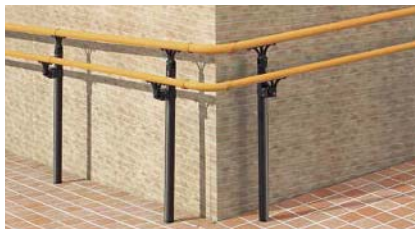
B型(上段)+A型(下段)(樹脂笠木) 上部笠木用アルミ柱 埋込み式 コーナースロープ納まり [ライトブラウンP+ブラック]