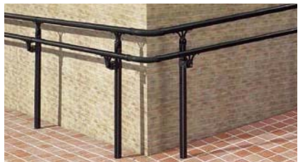
B型(上段)+A型(下段)(アルミ笠木) 上部笠木用アルミ柱 埋込み式 コーナースロープ納まり [ブラック]