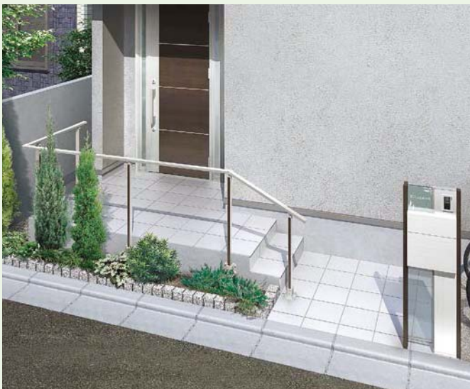
上面ベース用角柱+側面ベース用角柱使用 笠木:ナチュラルシルバーF 柱:ナチュラルシルバーF+柿渋