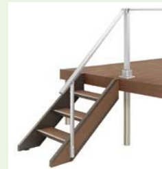
【樹ら楽ステージ】 デッキ用ステップ