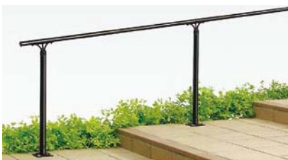
A型(アルミ笠木) 上部笠木用アルミ柱 ベースプレート式 階段納まり [ブラック]