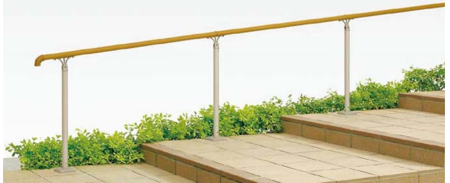
B型(樹脂笠木) 上部笠木用アルミ柱 ベースプレート式(足元カバーつき) 階段納まり [ライトブラウンP+シャイングレー]