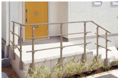
A型(アルミ笠木) 上部笠木用アルミ柱(埋込み柱) 側面ベースプレート式 横ビームつき [シャイングレー]