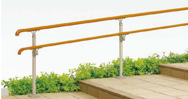
B型(上段)+A型(下段)(樹脂笠木) 上部笠木用アルミ柱 埋込み式 (足元カバーつき) 階段納まり [オレンジ+シャイングレー]