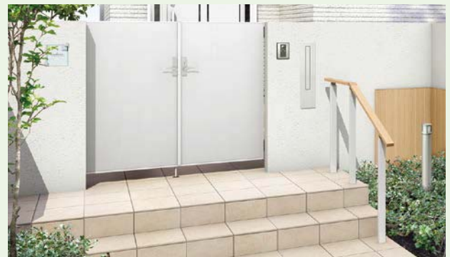
埋込用角柱使用 笠木:クリエパール 柱:ナチュラルシルバーF