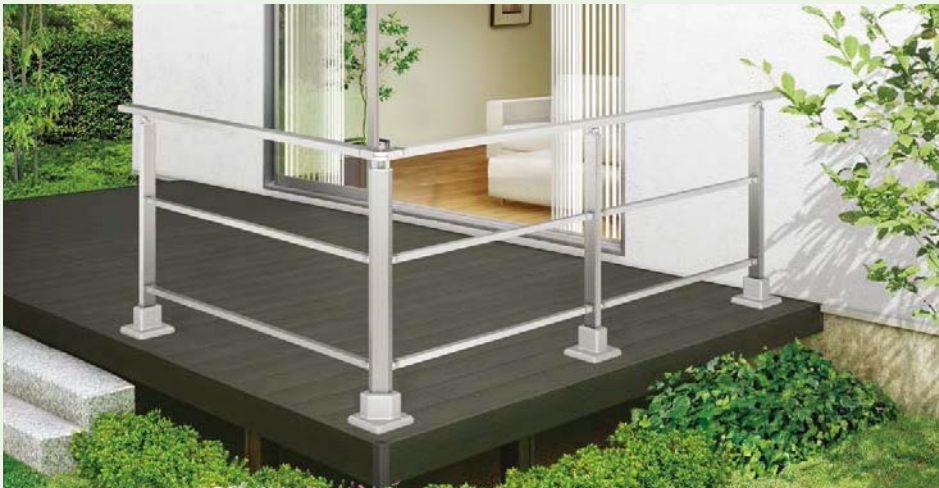
【樹ら楽ステージ】デッキ上施工