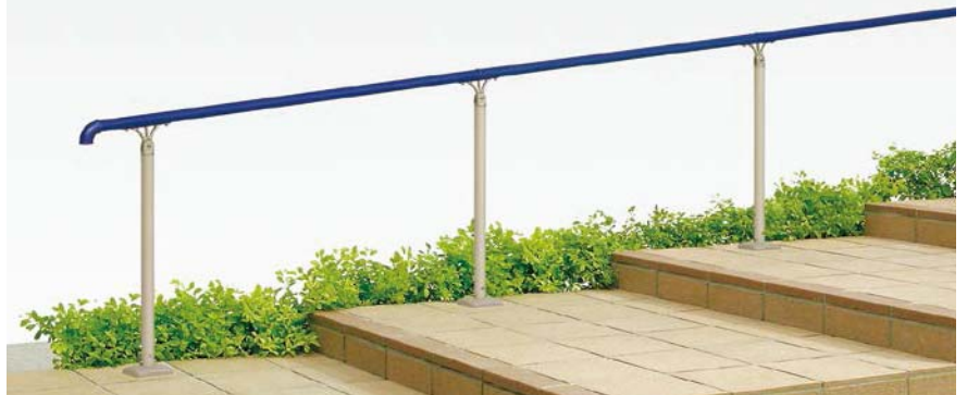
B型(樹脂笠木) 上部笠木用アルミ柱 埋込み式(足元カバーつき) 階段納まり [ブルー+シャイングレー]